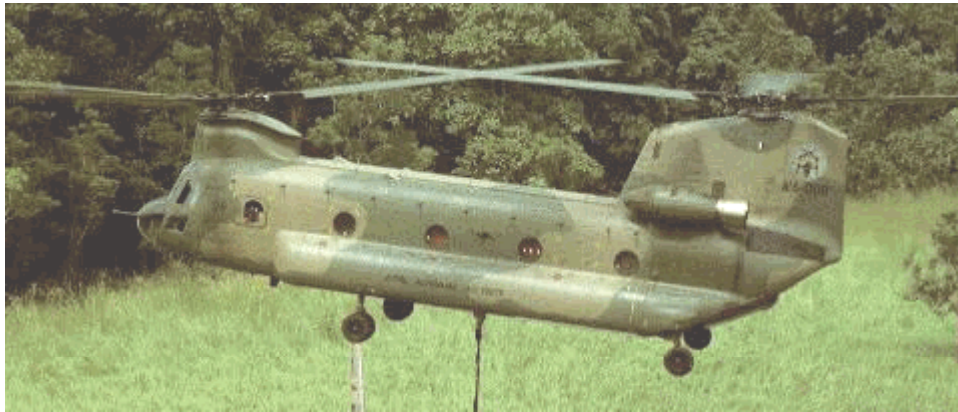
Un hélicoptère Chinook

Cet enquêteur explique également qu'en 1993, il eut la possibilité d'espionner des hélicoptères Chinook dans la région (Sand Mountain) menant, semblerait-il, des opérations clandestines. Ces engins se dirigeaient vers la base de Fort Campbell, Kentucky.