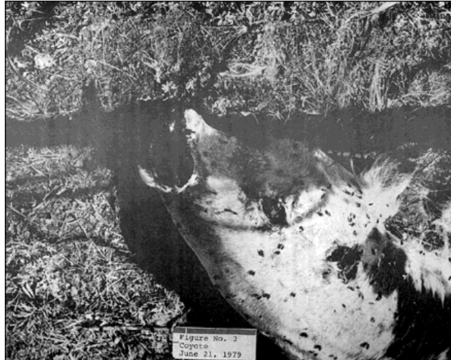
Photo numéro 3 tirée du rapport de Rommel concernant un cas datant du 21 Juin 1979

Récemment, il remarqua : «Le problème, c'est que vous avez des Ranchers qui voient quelque chose qu'ils n'ont encore jamais observé ; vous avez des agents de police même pas capables de retrouver leurs propres voitures de service qui affirment «on dirait de la chirurgie par laser» et vous avez des journalistes qui raffolent de ce genre d'histoire et qui les propagent» (17).