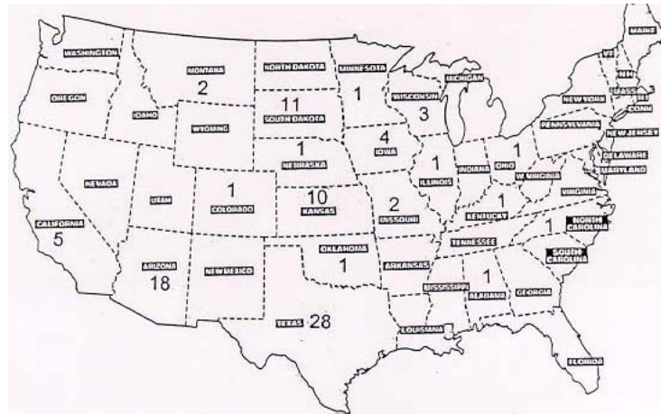
Illustration du nombre de cas d'animaux mutilés rapportés par Etat

Seuls 199 questionnaires ont été retournés, soit 4,91 %, ce qui est très faible.